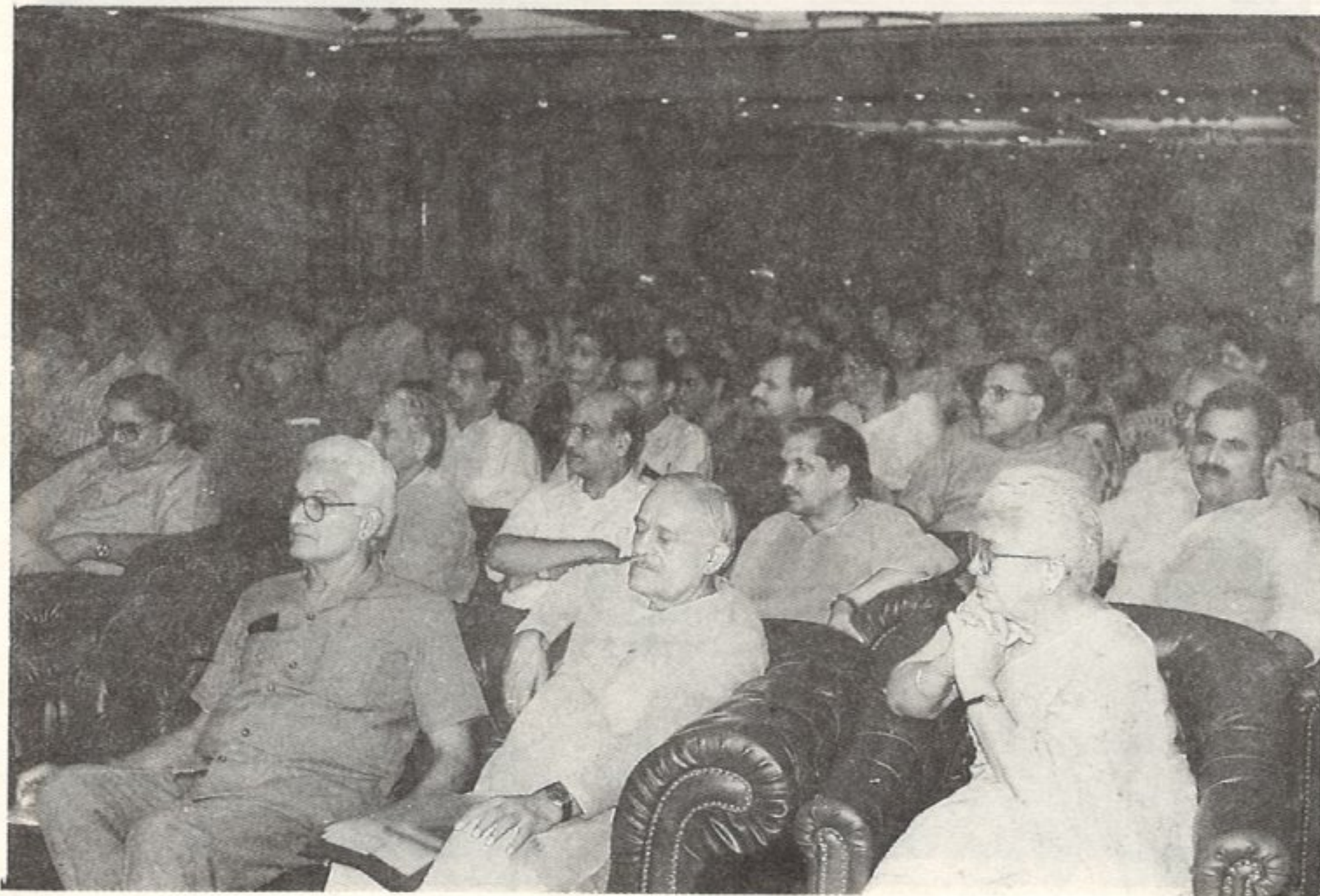
उपस्थित सम्मानित अतिथिगण एवं सदस्यगण